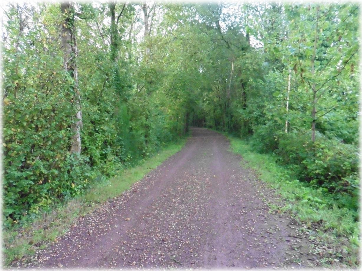
Ook vandaag volgen we deels de oude treinbedding van Cherbourg naar de Mont-Saint-Michel.