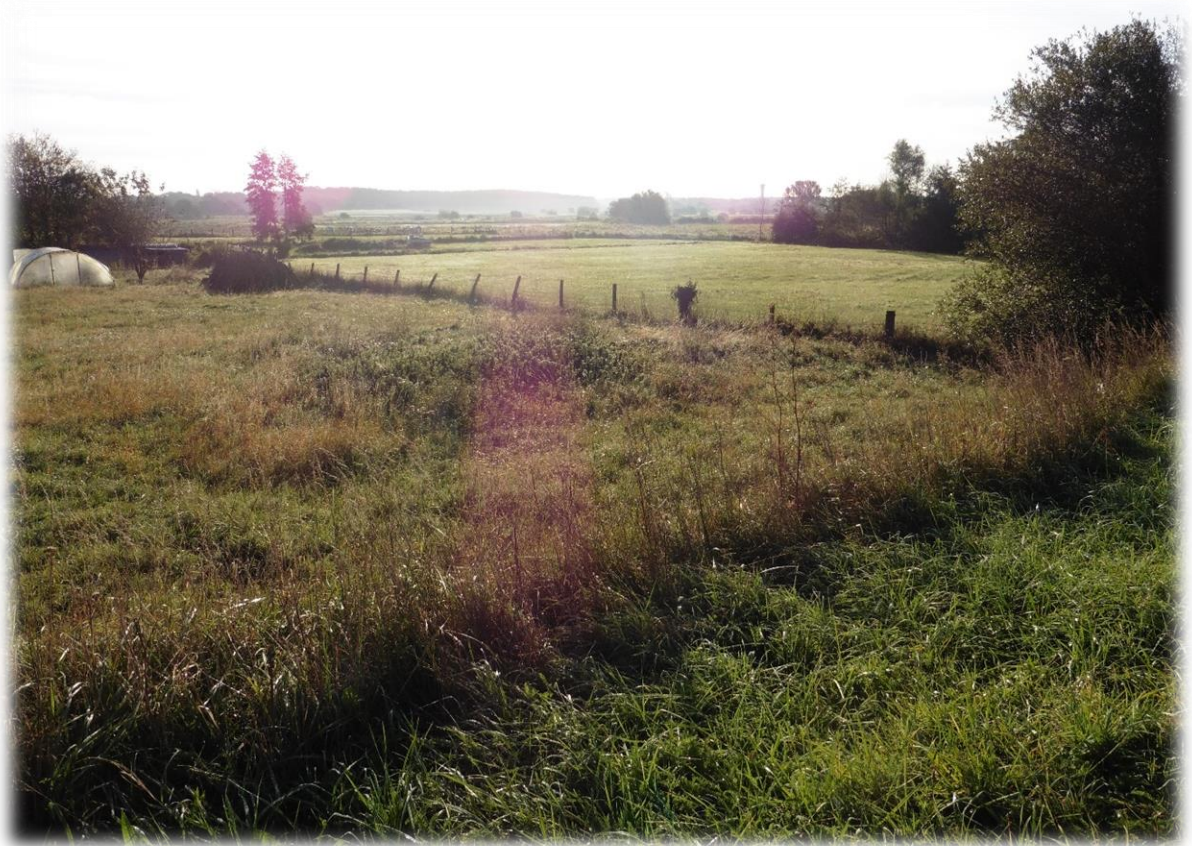
Vandaag volgen we vooral de oude treinbedding van de lijn Cherbourg – Mont-Saint-Michel.