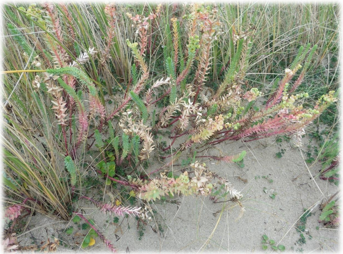
Ook in het zand groeien mooie plantjes.