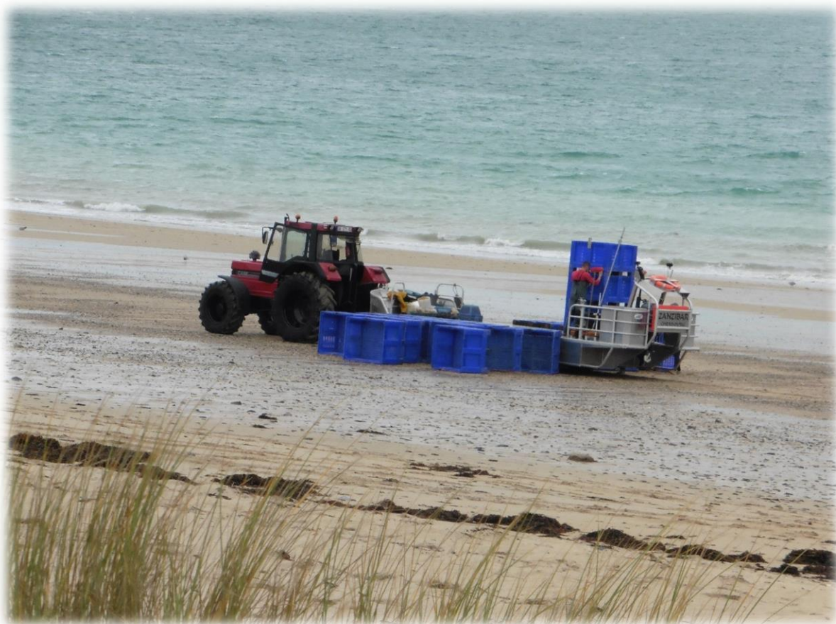
Vissers plaatsen hun lege bakken op het strand.