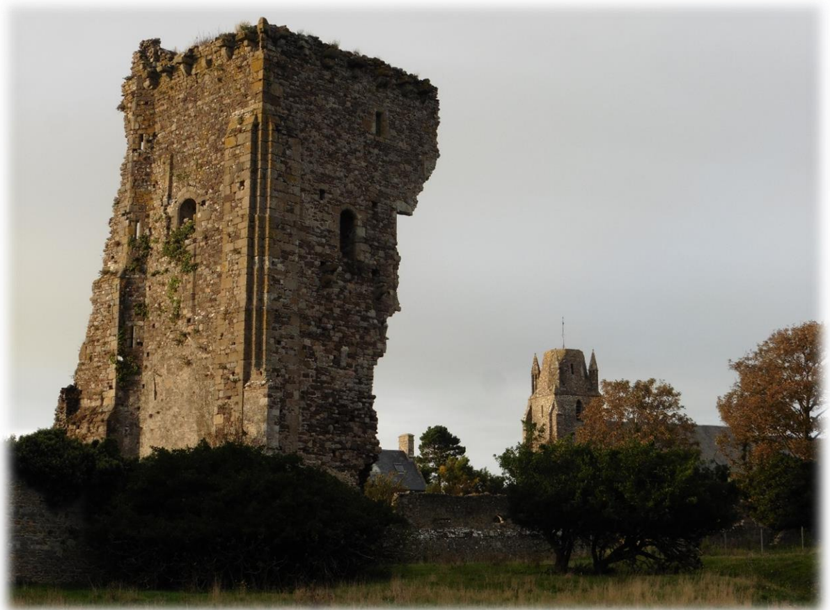
De donjon van Regnéville, met zijn karakteristieke silhouet, is in de loop der jaren het symbool van de stad geworden en zijn imposante massa domineert de overblijfselen van het