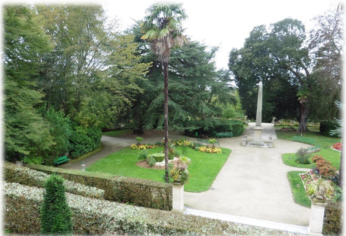
De botanische tuin, niet ver van de kathedraal, is een zeer rustgevende plaats, ideaal om te wandelen. Wij hebben er onze picknick opgegeten. De tuin vormt een harmonieus