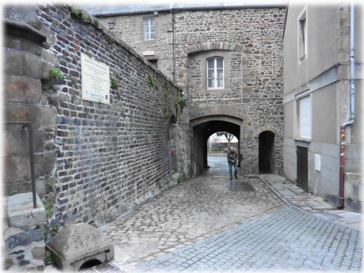
Granville ontstond en groeide op een vooruitstekende rots, waardoor het ook weleens het 'Monaco van het Noorden' wordt genoemd. Het leven in de stad draait in hoofdzaak rond de